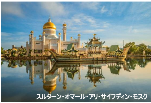
スルタン・オマル・アリ・サイフディン・モスク