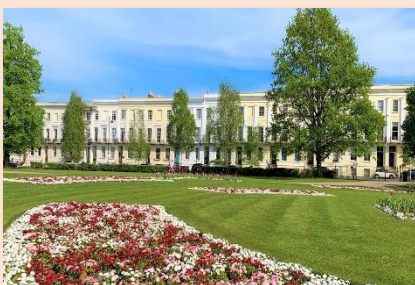
(チェルトナムの風景)